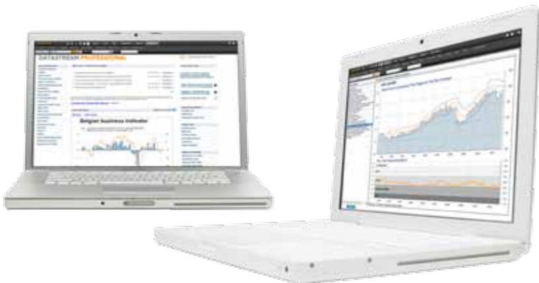
トムソン・ロイター データストリーム プロフェッショナル

Thomson ONE, Thomson Reuters Eikon, Thomson Reuters Datastream Professional Thomson Reuters Deals Business Intelligence, Thomson Reuters Advanced Analytics Lipper, Thomson Reuters DataScope