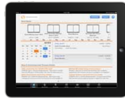
トムソン・ロイター ACCELUS