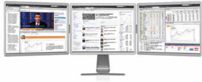
トムソン・ロイター・アイコン